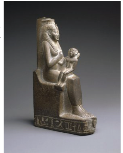
Isis Nursing the Child Horus, ca. 664-525 B.C.E. slate, (19.1 x 4.1 x 10.8 cm). Brooklyn Museum,

Car l'Éternel, ton Dieu, est un feu dévorant, un Dieu jaloux. Lorsque tu auras des enfants, et des enfants de tes enfants, et que vous serez depuis longtemps dans le pays, si vous vous corrompez, si vous faites des images taillées, des représentations de quoi que ce soit, si vous faites ce qui est mal aux yeux de l'Éternel, votre Dieu, pour l'irriter, j'en