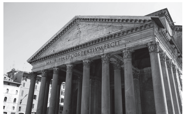
Le Panthéon, Rome

Depuis lors le culte de Marie prend racine et se propage. Cependant, d'après Mabillon, la Vierge n'avait pas encore de fête à la fin du 5 e siècle dans le calendrier des Églises d'Afrique. En 606 le Panthéon (temple païen de Rome destiné à recevoir les statues de tous les dieux) lui est consacré ainsi qu'à tous les saints [pour devenir la basilique Santa Maria ad Martyres 14 ]. Désormais le chemin est largement frayé